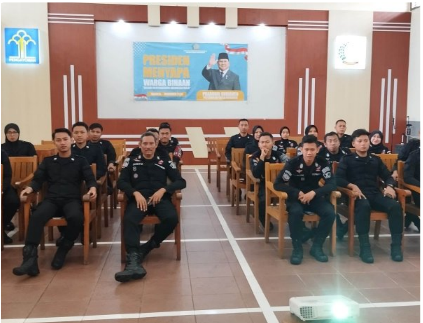
Rutan Blora Ikuti Sosialisasi Pedoman Uji Kompetensi Jabatan Fungsional Pembina Keamanan dan Pengaman Pemasarakatan

Blora - Rumah Tahanan Negara (Rutan) Kelas IIB Blora turut berpartisipasi dalam kegiatan Sosialisasi Pedoman Uji Kompetensi Jabatan Fungsional Pembina Keamanan Pemasarakatan dan Pengaman Pemasarakatan yang